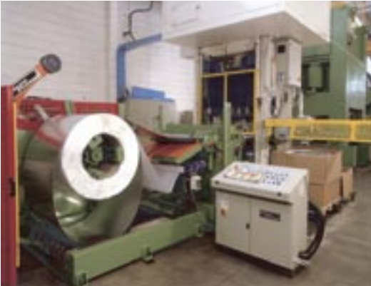
Vollautomatische Presse für Reflektorproduktion