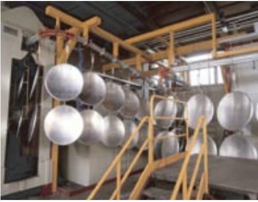
Lackierstrasse für Pulverbeschichtung der Reflektoren