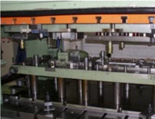
Presse mit Mehrstufenwerkzeug für Herstellung der Halterungen