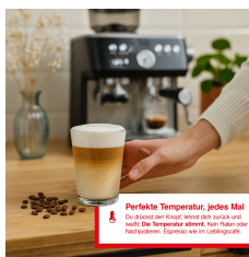
Perfekte Temperatur, jedes Mal Die Temperatur ist das Wichtigste für einen guten Kaffee. Die Temperatur ist perfekt, wenn du sie selbst steuern kannst. Perfekte Temperatur, jedes Mal.