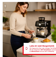
Latte-Art statt Morgenhektik Die Cappuccino-Milch oder der heiße Latte ist das, was du brauchst, um den Tag zu starten. Mit der integrierten Milchaufschäumung zu Hause. Die Milchschäume sind aus dem besten Material.