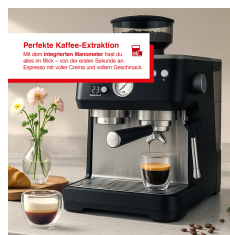
Perfekte Kaffee-Extraktion Mit dem integrierten Mahlwerk hast du alles im Blick – von der ersten Bohne bis zum Espresso mit voller Crema und perfektem Geschmack.