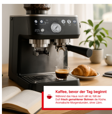
Kaffee, bevor der Tag beginnt Weckt dich fröhlich und gibt dir den Start. Durch geschmeckten Bohnenkaffee zu Hause. Konzentration steigt und der Tag beginnt.

Artikelnummer: S0225 EAN: 7611210980704 UVP: 799,90 EUR EK: nach Login