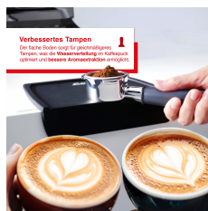
Verbessertes Tampen Das flache Siebträger-Design ermöglicht ein gleichmäßigeres Tampen, was die Wasserverteilung im Kaffeebohnensatz verbessert und bessere Extraktionsergebnisse ermöglicht.