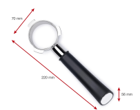
Lieferumfang 1x Bodenloser Siebträger für Typ 1019 oder 1170

Artikel-Abmessungen (LxBxH): 22 x 9 x 7 mm Gewicht (netto): 372 g Karton-Abmessungen (LxBxH): 22 x 9 x 7 mm Gewicht (brutto): 500 g