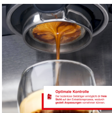
Optimale Kontrolle Das transparente Siebträger-Design ermöglicht die ideale Sicht auf den Extraktionsprozess, wodurch gezielt Anpassungen vorgenommen werden können.