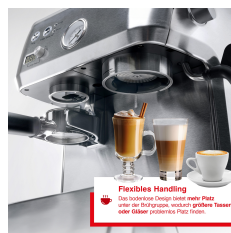
Flexibles Handling Das innovative Design bietet mehr Platz unter der Siebträger-Kanne, was auch größere Tassen oder Filterbehälter problemlos ermöglicht.