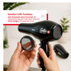
Komfort trifft Funktion Kein Kribbeln! Keine Föhnwind. Die Haartrockner liegt gut in der Hand, lässt sich leicht einengen und lässt sich ab- und ansetzen.