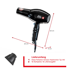
Lieferumfang Swiss Perfection-Schwarz-Haartrockner Typ 440 1x Schutzgitter, 1x Luftansauggitter

Artikel-Abmessungen (LxBxH): 261 x 253 x 89 mm Gewicht (netto): 770 g Karton-Abmessungen (LxBxH): 245 x 216 x 89 mm Gewicht (brutto): 1010 g