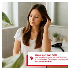
Glanz, den man fühlt Nach dem Trocknen glänzt dein Haar nicht nur – so soll es auch sein. geschmeidig und gepflegt an. Kein Styling, kein Frizz.