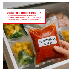
Starke Folie, starker Schutz Die stabile Folie schützt Ihre Lebensmittel vor Luft und Feuchtigkeit. Die stabile Folie ist auch für das Garen geeignet.