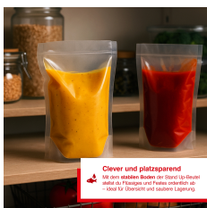
Clever und platzsparend Mit dem stabilen Boden des Stand-Up-Beutels lässt sich Flüssigkeit und Pulver einfach abfüllen. Ideal für übersichtliche und saubere Lagerung.