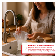
Praktisch & wiederverwendbar Mit einem praktischen Verschluss lässt sich das Material leicht öffnen und wiederverwenden.