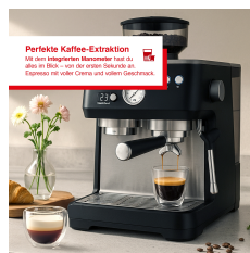
Perfekte Kaffee-Extraktion Mit dem integrierten Mahlwerk hast du alles im Blick – von der ersten Bohlung bis zum Ende der letzten Crema und jedem Latte-Tipp.