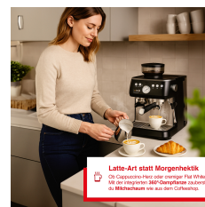
Latte-Art statt Morgenhektik Die perfekte Mischung aus Kaffee und Milch. Die perfekte Mischung aus Kaffee und Milch. Die perfekte Mischung aus Kaffee und Milch.