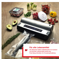
Für alle Lebensmittel Das flexible Label ist abwaschbar für trockene und feuchte Lebensmittel sowie eine Filterkammer für Cholesterinrückstände.