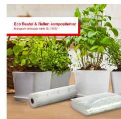
Eco Beutel & Rollen kompostierbar Biologisch abbaubar nach EN 13432

Artikel-Abmessungen (LxBxH): 191 x 400 x 106 mm Gewicht (netto): 3697 g Karton-Abmessungen (LxBxH): 290 x 450 x 155 mm Gewicht (brutto): 5500 g