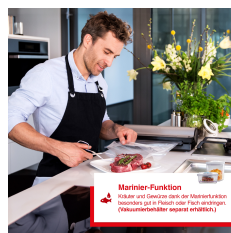
Marinier-Funktion Pulsen und Garen sind die Marinierfunktion, besonders gut in Fleisch oder Fisch anbringen. (Zusammensteller separat erstellen)