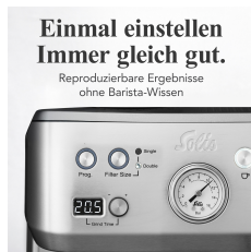
Einmal einstellen Immer gleich gut.

Reproduzierbare Ergebnisse ohne Barista-Wissen