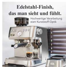
Edelstahl-Finish, das man sieht und fühlt.

Reproduzierbare Ergebnisse ohne Barista-Wissen