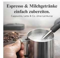
Espresso & Milchgetränke einfach zubereiten.

Für den Alltag - nicht fürs Experimentieren