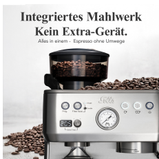
Integriertes Mahlwerk Kein Extra-Gerät.