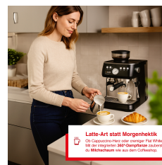
Latte-Art statt Morgenhektik Die Solis hat eine integrierte Dampffunktion, die die Milch für den perfekten Milchschaum aufheizt und die Milchschäume wie aus dem Himmel.