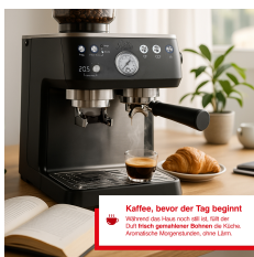
Kaffee, bevor der Tag beginnt Weckt die Hausfrau mit der Solis. Durch gereinigter Bohnen die Küche. Konstante Temperatur, jedes Mal.

Artikelnummer: SB0225 EAN: 4043745012255 UVP: 907,60 EUR EK: nach Login