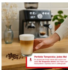
Perfekte Temperatur, jedes Mal Die Solis hat eine integrierte Temperaturkontrolle, die die Temperatur konstant bei 90°C hält. Perfekte Temperatur, jedes Mal.